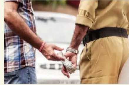
महिलांचे संरक्षण अधिनियम कलम ४९८

अहिल्यानगर- नवरा-बायकोच्या भांडणात तपासात सहकार्य करण्यासाठी तीस हजारांची लाच घेतल्याप्रकरणी तोफखाना पोलीस ठाण्याच्या पोलीस कर्मचाऱ्यावर लाच लुचपत प्रतिबंधक विभागाने कारवाई केली. आज, बुधवारी दुपारी उशिरा झालेल्या या कारवाईने खळबळ उडाली असून, सायंकाळी उशिरापर्यंत पुढील कायदेशीर प्रक्रिया चालू होती.