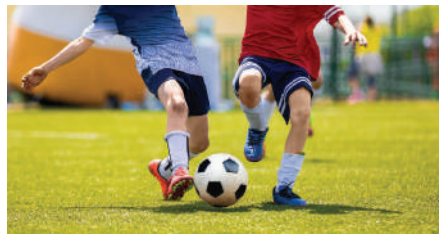
दैनिक आकर्षण । प्रतिनिधी

संघनोंदणीसाठी आवाहन । विजेतेपदासाठी 'सुपर लीग' पध्दतीने रंगणार चुरस