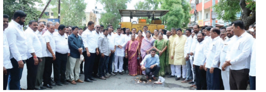
दैनिक आकर्षण | प्रतिनिधी

गुलमोहर रोड रस्ता डांबरीकरण कामाचा शुभारंभ