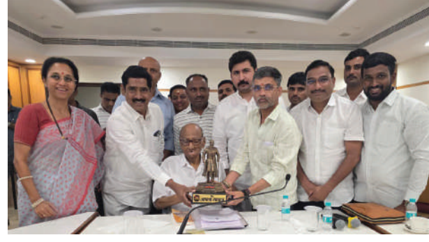
दैनिक आकर्षण | प्रतिनिधी

'आपला मावळा'च्या कार्याला नवी ऊर्जा | खासदार नीलेश लंके यांच्या उपस्थितीत शिवचरित्र संवर्धनाचा निर्धार