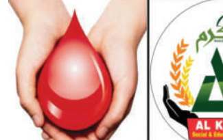
दैनिक आकर्षण । प्रतिनिधी

अहिल्यानगर- समाजात रक्ताची गरज दिवसेंदिवस वाढत असून अनेक रुग्णांना वेळेवर रक्त उपलब्ध व्हावे, या सामाजिक उद्देशाने इंदुल अजहा निमित्त अल करम हॉस्पिटलच्या वतीने रविवारी २४ मे २०२६ रोजी रक्तदान शिबीराचे आयोजन करण्यात आले आहे. हे शिबीर सायंकाळी ५ ते रात्री ८ या वेळेत अल करम हॉस्पिटल किम्सगेट रोड, इंगळे मॅडिकलजवळ आयोजित करण्यात आले आहे.