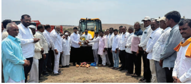
दैनिक आकर्षण । प्रतिनिधी

जलयुक्त शिवार योजनेमुळे राज्यातील अनेक दुष्काळग्रस्त भागांना मोठा दिलासा मिळाला