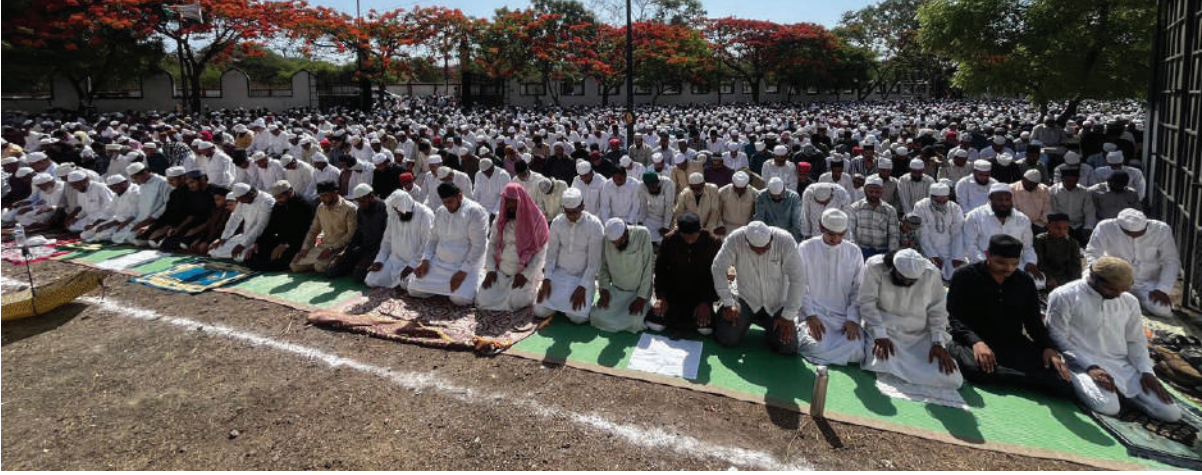
बकरी ईद निमित्त मुस्लिम बांधवांच्या वतीने कोठला येथील ईदगाह मैदान येथे सामूहिक नमाज पठण करण्यात आले

वर्ष ५ | अंक २२९ | गुरुवार २८ मे २०२६ | पाने ४ | मूल्य ₹ २ | https://epaper.dainikaakarshan.com | E-mail- dainikaakarshan@gmail.com | RNI NO. MAHMAR/2021/84322