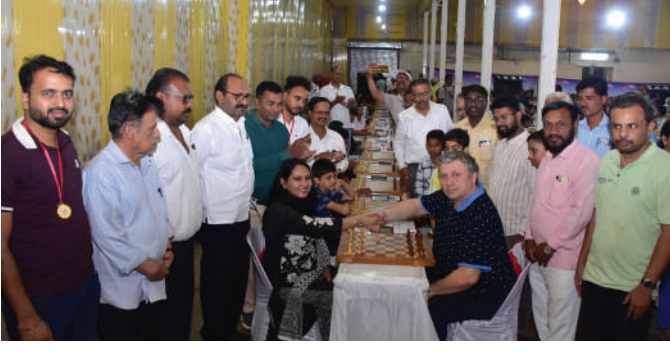
दैनिक आकर्षण । प्रतिनिधी

अहिल्यानगर- मोतीलालजी फिरोदिया बुद्धिबळ स्पर्धेत पाचव्या फेरीस उत्साहात प्रारंभ