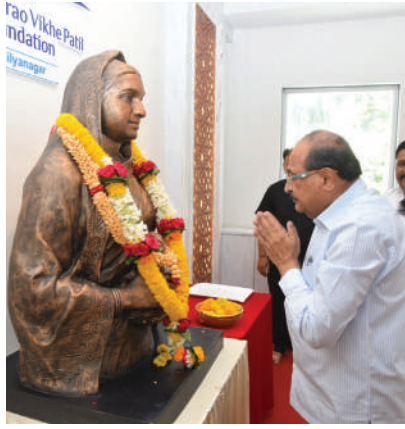
दैनिक आकर्षण । प्रतिनिधी

अहिल्यानगर- महिलांच्या सक्षमीकरण करीता केंद्र आणि राज्य सरकारने सुरू केलेल्या योजना मागे पुण्यश्लोक अहिल्यादेवी होळकर यांच्या विचारांची प्रेरणा असल्याचे प्रतिपादन जलसंपदा तथा पालक मंत्री ना.राधाकृष्ण विखे पाटील केले. पुण्यश्लोक अहिल्यादेवी होळकर यांच्या ३०१ व्या जयंती दिनाच्या निमित्ताने मंत्री विखे पाटील यांनी पंचश्री डॉ विठ्ठलराव विखे पाटील फाउंडेशनच्या मुख्य कार्यालयात पुण्यश्लोक अहिल्यादेवी होळकर यांच्या प्रतिमेस पुष्पहार अर्पण करून अभिवादन केले.भाजपाचे